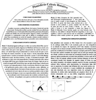
Parte de Trás (Instruções)